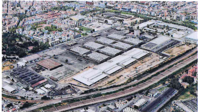
L'Ortomercato oggi, col nuovo padiglione

Soluzioni pensate per la logistica moderna, la sostenibilità e la gestione informatizzata delle merci.