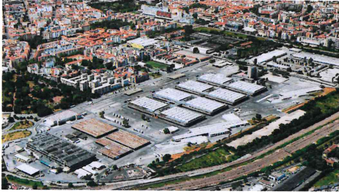
L'Ortomercato prima degli interventi edili

L'edificio è realizzato secondo i più moderni standard tecnologici e di sostenibilità ambientale, potendo vantare un sistema di logistica centralizzato e digitalizzato per le operazioni di movimentazioni delle merci, un impianto di produzione energetica da fonti rinnovabili con una potenza di 11,3 MWT e standard all'avanguardia, di sicurezza operativa e alimentare.